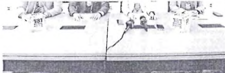
COLETIVA divulgou informações sobre a operação que prendeu o suspeito de estupro