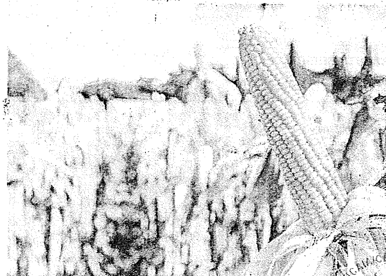
MILHO é um dos destaques da safra cearense neste ano, com alta 33,6%

São 8,5 milhões de toneladas a mais que a safra obtida em 2021. Mas, assim como no Ceará, houve uma redução de expectativa em relação à esti-