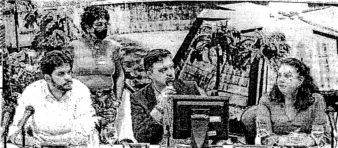
COLEGIADO vai debater também contrato de concessão da Enel no Ceará

Estado do Ceará - Prefeitura Municipal de Caucaia - Aviso de Licitação - Pregão Eletrônico Nº 2022.05.12.01-SDST. A Pregoeira da Prefeitura Municipal de Caucaia - Ceará, torna público, para conhecimento dos interessados, que no próximo dia 02 de Junho de 2022, às 09h (nove horas), através de endereço eletrônico www.comprasnet.gov.br (Comprasnet), estará realizando licitação, na modalidade Pregão Eletrônico, critério de julgamento Menor Preço por Lote, tombado sob o nº 2022.05.12.01-SDST, com fins a Registro de Preços visando futuras e eventuais aquisições de materiais elétricos, hidráulicos, ferragens e pintura para atender as necessidades da Secretaria de Desenvolvimento Social e Trabalho do Município de Caucaia/CE, conforme Projeto Básico/Termo de Referência em anexo do Edital, o qual encontra-se na íntegra na Sede da Comissão, situada a Rua. Coronel Correia nº 1073, Parque Soledade, Caucaia/CE. Maiores informações no endereço citado, no horário de 08:00h às 12:00h ou pelo site http://municipios.tce.ce.gov.br/licitacoes . A Pregoeiro(a).