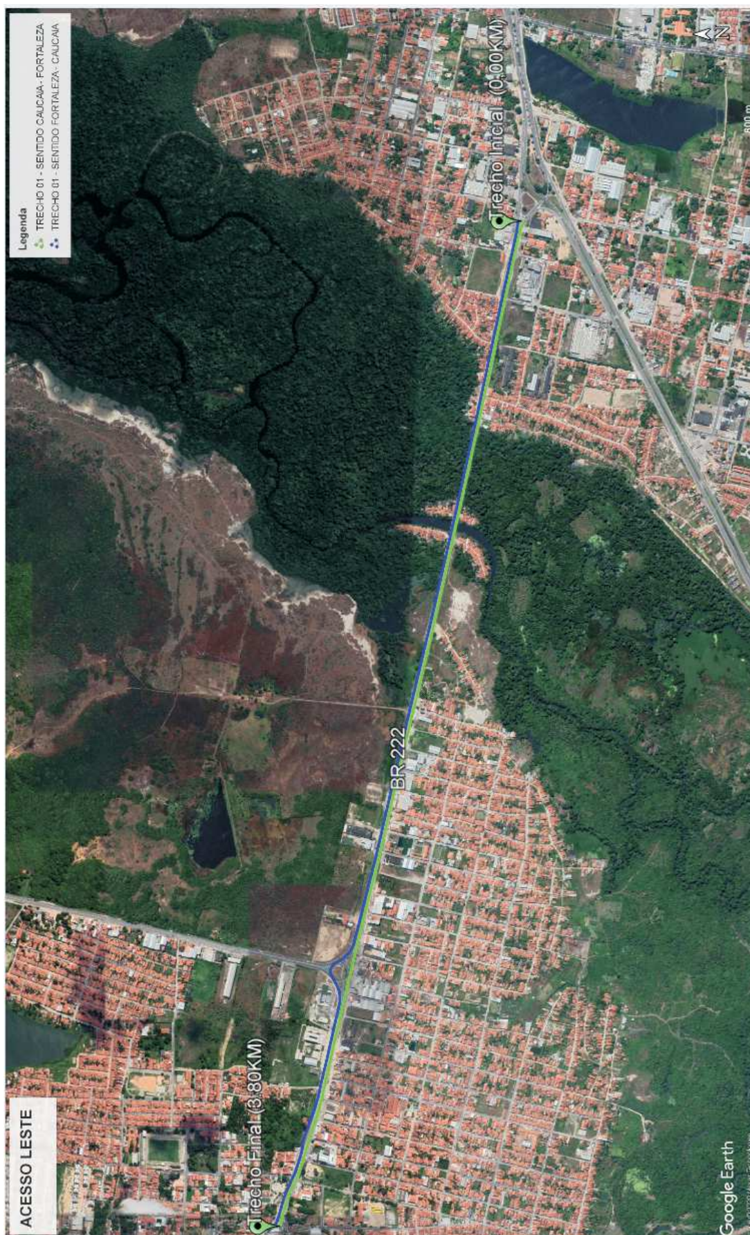
FIGURA2. Mapa com o trecho de Implantação do Inventário – Acesso Leste

Art. 2º. Fica o Poder Executivo Municipal de Caucaia autorizado a firmar todos os instrumentos jurídicos e a praticar todos os atos necessários para a efetivação da cessão de uso, ou da doação, de que trata a presente lei. Art. 3º. Esta lei entra em vigor na data de sua publicação, revogadas todas as disposições em contrário. PAÇO DA PREFEITURA DE CAUCAIA , em 21 de julho de 2020. NAUMI GOMES DE AMORIM - Prefeito de Caucaia.