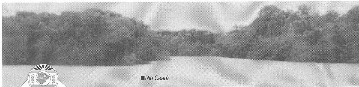
■ Rio Ceará