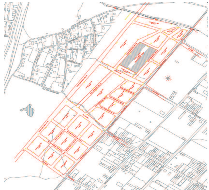
ANEXO III da Lei nº 2.603, de 31 de dezembro de 2014. Lista de Ocupantes Contemplados com Direito Real de Uso sobre imóvel objeto da Mat. 022.212- RGI de Caucaia.