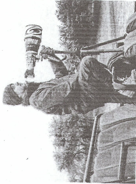
O FOTOGRAFO Fábio Arruda idealizou a série

A série "Expedições Fotográficas", uma parceria entre OP+ e a Barong Audiovisual, será lançada amanhã, tendo inicialmente previstas duas temporadas. A primeira traz aspectos naturais, sociais e culturais da África do Sul e a segunda com foco na Islândia e com lançamento em maio, em data a ser definida. A série é ainda um importante guia turístico sobre os dois países, tanto para viajantes quanto para agentes.