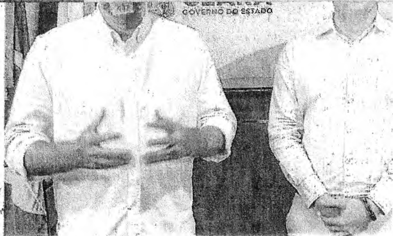
ELMANO destaca que antecipação do 13º vai beneficiar 160 mil servidores

"É muito importante para o comércio, para os serviços, mas, especialmente, para as famílias dos servidores", comentou o governador.