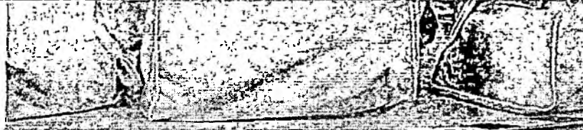
40 ALUNOS receberam o certificado de conclusão do curso de doces e salgados

O programa funciona como uma ferramenta de inclusão social, ofertando cursos de qualificação para grupos socialmente vulneráveis e entregando kits instrumentais de trabalho para que as pessoas iniciem sua trajetória profissional. Segundo a pasta, nos últimos sete anos, quase 50 mil pessoas foram capacitadas no programa.