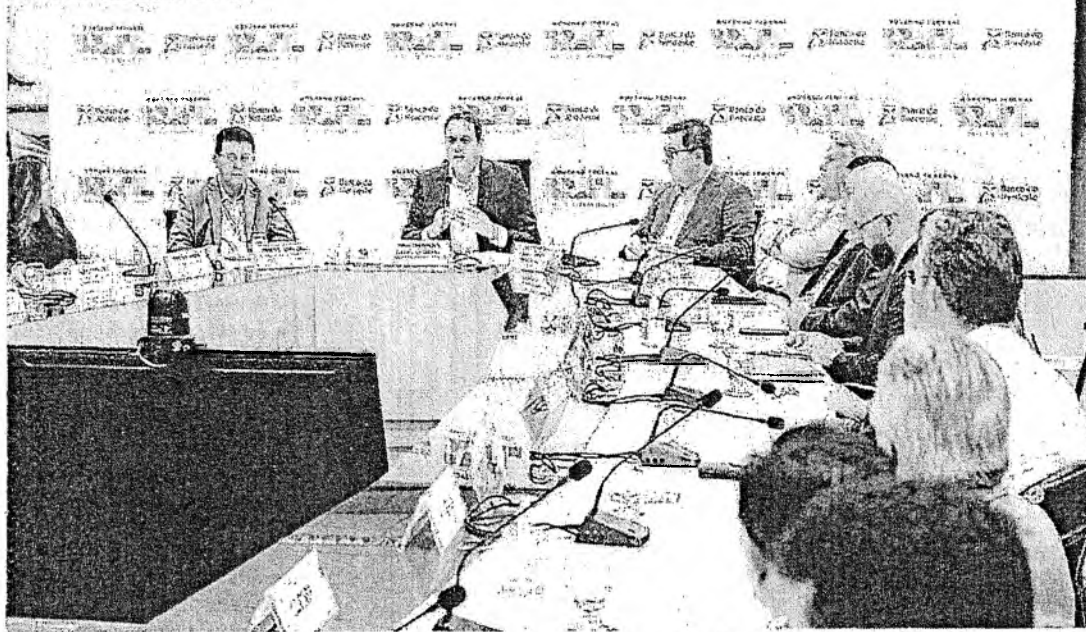
BANCO do Nordeste (BNB) estuda formas de expandir fonte de recursos em 2024

foram aproveitadas as "sobras" muito grande de financia-