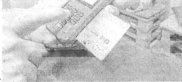
USO DE CARTÃO de crédito é contabilizado pelo Banco Central no saldo de operações

Ao mesmo tempo, a desoneração do poder aquisitivo observado nos últimos anos leva os cearenses a ter o crédito como uma das poucas opções para manter o ritmo de compra, mesmo que para