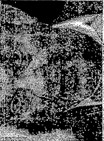
SARTO mudanças seguidas na gestão.

WWW.OPOVO.COM.BR QUARTA-FEIRA FORTALEZA - CEARÁ - 5 DE ABRIL DE 2023