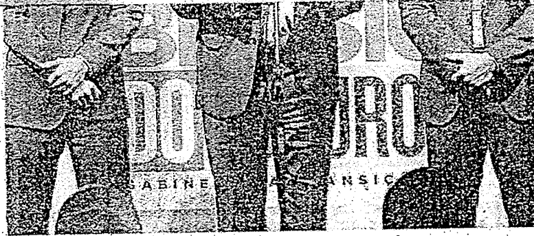
FERNANDO HADDAD ressaltou que equipe possui grande experiência no serviço público

Questionado sobre indicações para comandar bancos públicos, o futuro ministro informou que irá discutir na semana que vem com o presidente